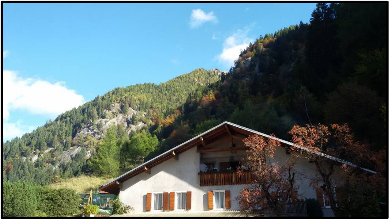
A sinistra del rifugio le “Placche della cascata di Danerba”.